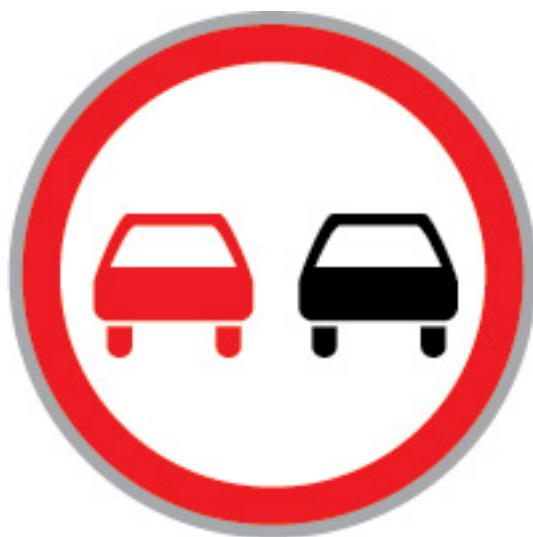
Посилення конкуренції на ринку праці